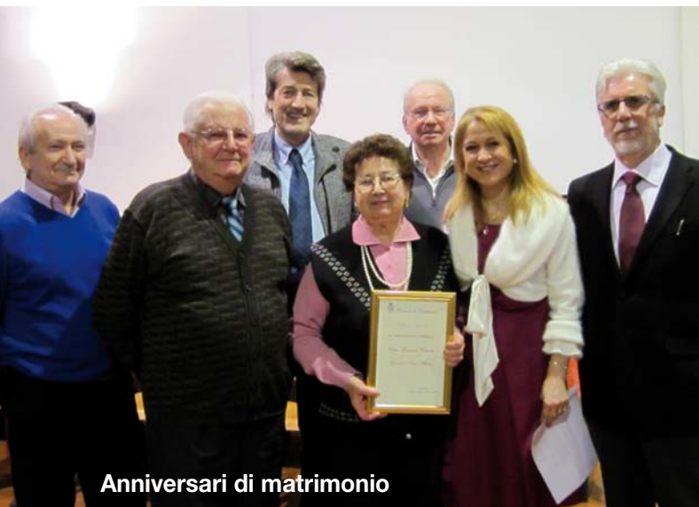
Anniversari di matrimonio