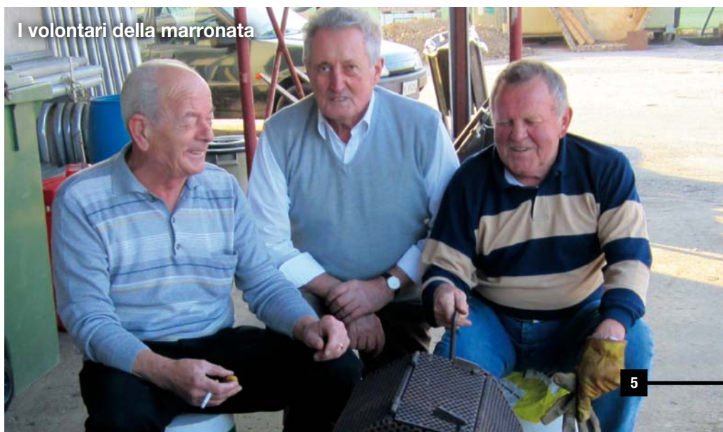
I volontari della marronata

Un grazie infine ai due Gruppi Caritas di Costabissara e Motta e al Banco Alimentare per il costante impegno nel seguire famiglie disagiate.