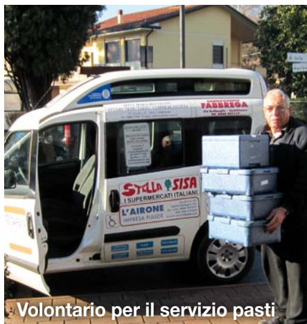
Volontario per il servizio pasti