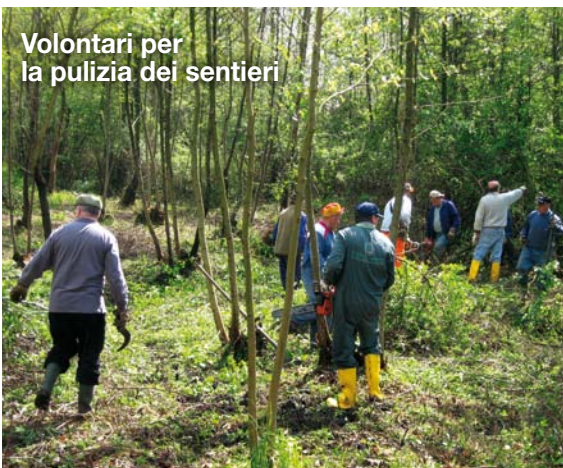
Volontari per la pulizia dei sentieri