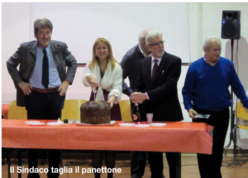
Il Sindaco taglia il panettone