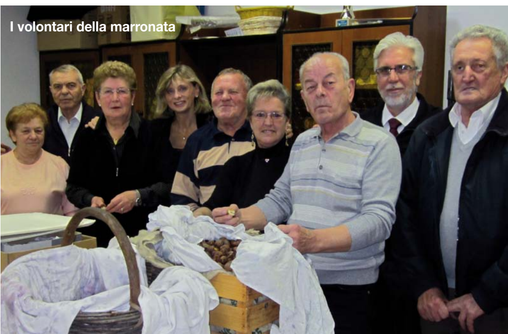
I volontari della marronata